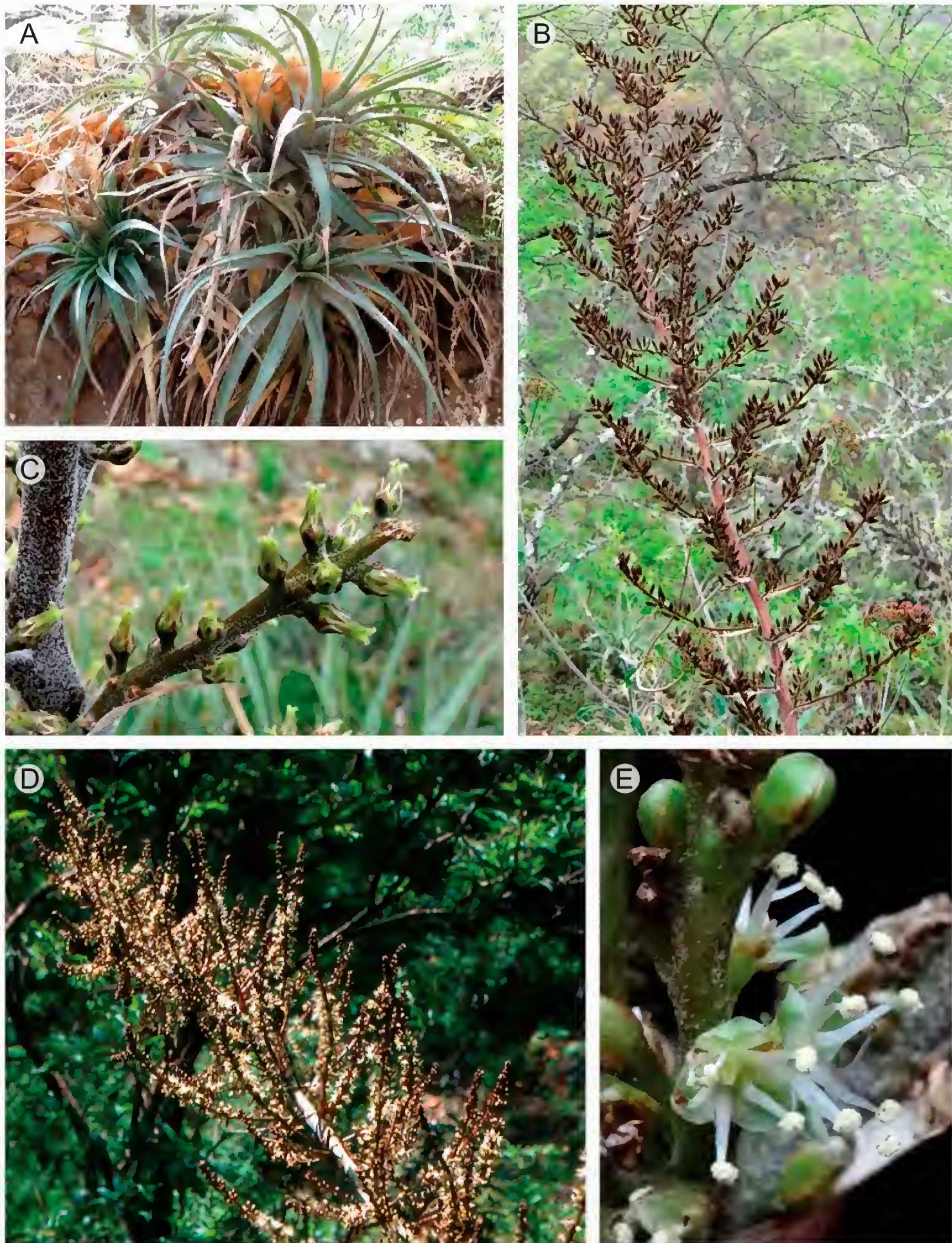
Fig. 1. Hechtia montis-frigidi González-Rocha, Espejo, López-Ferr. et Cerros-Tlatilpa. A. Rosetas. B. Inflorescencia con frutos maduros. C. Rama primaria con flores femeninas. D. Inflorescencia masculina. E. Flores masculinas.